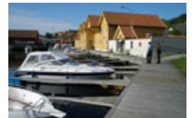
Gjestehamn Judaberg