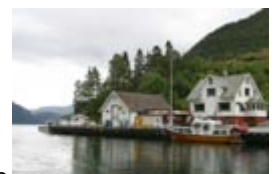
Erøy Landhandel