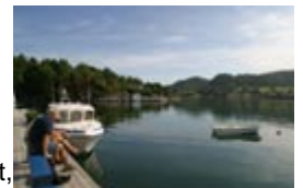
Bryggeprat i Sjernarøyane